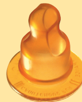
abgeschrägte Form (Kieferform)