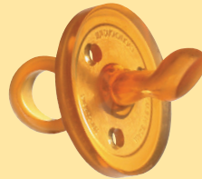
abgeschrägte Form mini + L (Kieferform)

L: ab 6 Mon. Art. 700010083 mini: 0 - 6 Mon. Art. 700010085